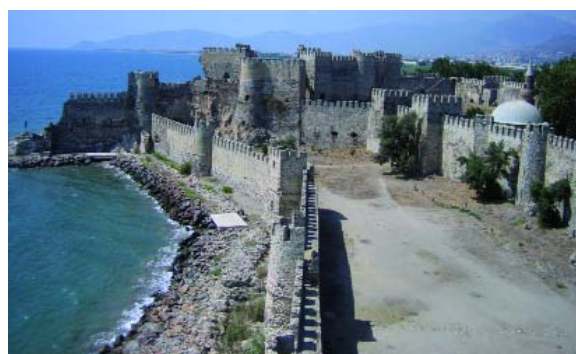
Mamure Kalesi. Diese Burg ist die am besten erhaltene und schönste Kreuzritterburg an der türkischen Südküste.