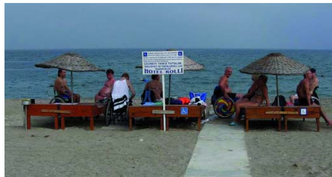
Rollstuhlgerechter Strandabschnitt vom Hotel Rolli Cap Anamur.