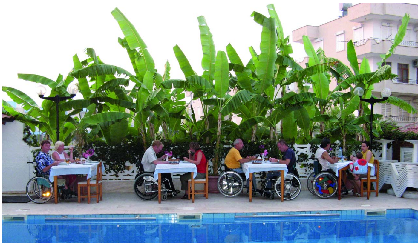
Am Pool vom Hotel Rolli Cap Anamur, Türkei.